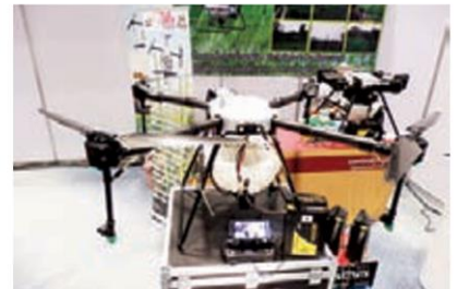
"โดรนปัญญา" โดรนเพื่อการเกษตรโดยฝีมือคนไทย