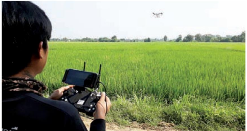
ใกล้ไกลแค่ไหน โดรนก็บินไปพ่นได้