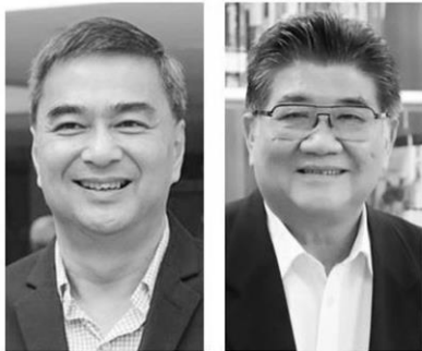
อภิสิทธิ์ เวชชาชีวะ ภูมิธรรม เวชยชัย

6 พ.ย. ชวน หลีกภัย ประธานสภาผู้แทนราษฎร นัดประชุมสภาสามัญสามัญ ครั้งที่ 2 ประจำปี'62 มีวาระรับทราบ 10 เรื่อง และญัตติสำคัญคือการตั้งกมธ.วิสามัญศึกษาผลกระทบจากคำสั่งมาตรา 44 ของหัวหน้าคสช. ...● ส่วนญัตติตั้งกมธ.วิสามัญศึกษาการแก้ไขรัฐธรรมนูญ ชินวรณีย์ บุญเกียรติ รองประธานวิปรัฐบาล คาดว่า จะพิจารณาวันที่ 13 พ.ย. เบื้องต้นมี 49 คน แบ่งเป็นโควตาครม. 12 คน