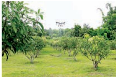
โดรนสามารถบินทำงานได้ทุกพื้นที่เพาะปลูก